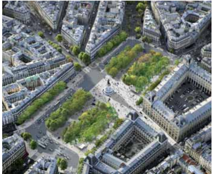
Trevolo & Viger-Kohler architectes/my lucky pixel/photo Air-images

La place de la République présentera un vaste espace libre de 2 ha, ouvert sur les Grands Boulevards. Les voies de circulation seront concentrées au sud de la place.