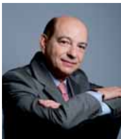
Philippe SOLIGNAC , président de la CCIP Paris

(Suite de l'interview parue dans Le Commerce de Paris n°42)