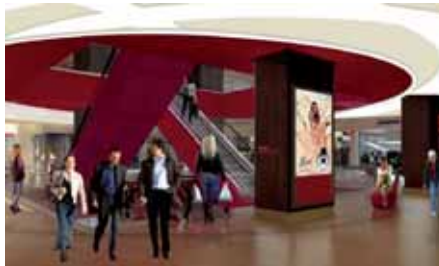
Un atrium central reflètera l'esprit « lounge » et convivial de la rénovation.

Les points marquants du projet sont la réalisation de deux puits de lumière, dont l'un via un magnifique dôme au niveau de l'atrium central.